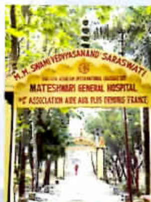
Entrée de l'Hôpital