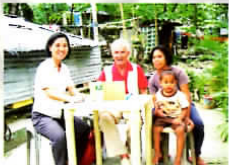
Ste Mary Grace