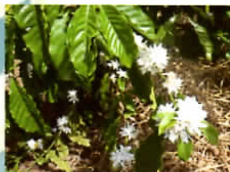
Caféier en fleur

Antsamolanga (Nosy Be) : biodynamie, compostage et production de plants en godets de légumes dans le jardin villageois