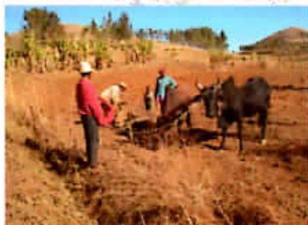
Labour avec zébu

■ À l'École supérieure d'agriculture de Bevalahala, intervention/conférence sur la bio-dynamie et mise en place des essais de culture sur l'exploitation agricole de l'école.