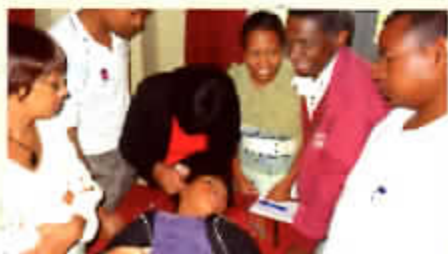
Pratique de l'auriculothérapie

■ À Antsirabé, ville thermale, formation à l'auriculothérapie de kinésithérapeutes de l'hôpital et rencontre avec les médecins et sages-femmes de la clinique-maternité où une collaboration ultérieure devrait être possible.