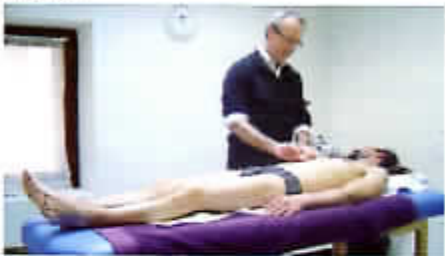
Séance de médecine traditionnelle chinoise