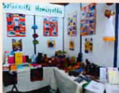
Stand au Salon Sésame de Nîmes