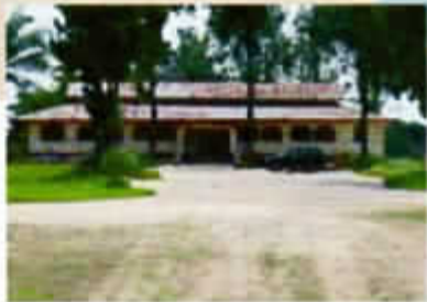
... l'hôpital de Makoua.