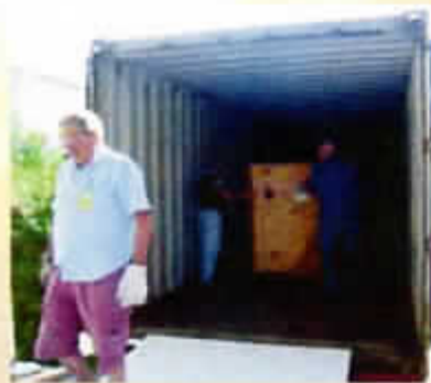
Chargement du container

Pas de mission mais préparation et envoi de matériel médical, dans un container de 60 pieds, au Congo-Brazzaville, à destination de l'Hôpital de Makoua, au nord du Congo.