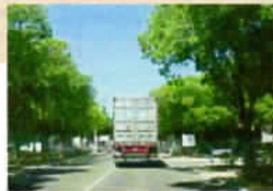
Départ du container vers...