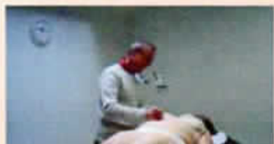
Consultation au Dispensaire de Crest