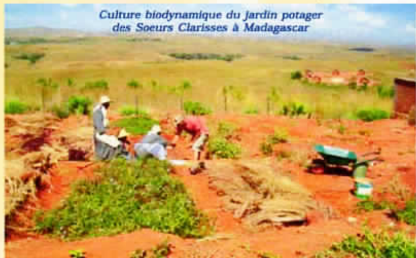
Culture biodynamique du jardin potager des Soeurs Clarisses à Madagascar