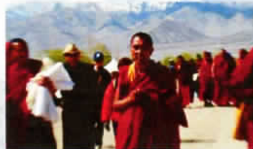
Geshe Tsewang Darje