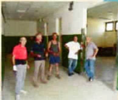
Mission accomplie : tout est entré dans le container !