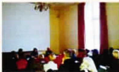
Atelier « Sophrologie et Cancer » dans une salle de la Mairie du 2 e Arrondissement