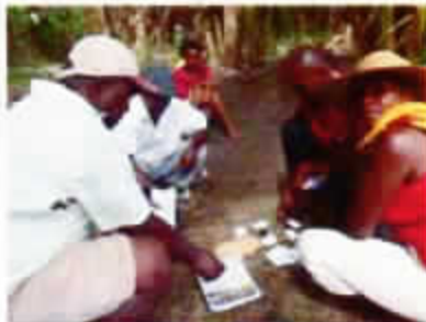
Distribution de semences Kokopelli

3 e mission, du 15 octobre au 15 décembre :