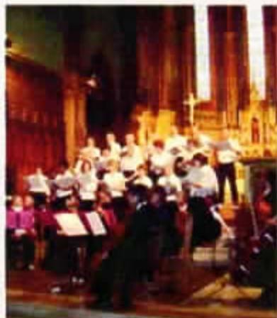
Concert de l'Avent en l'Église de Garons