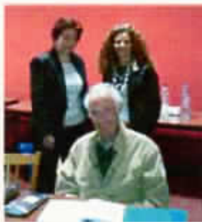
Les membres du bureau de SH 06