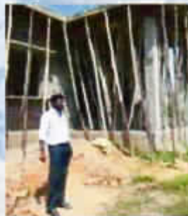
Avancement des travaux