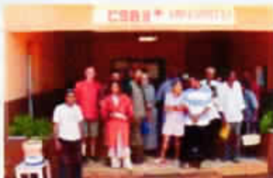
l'équipe de l'A.S.A