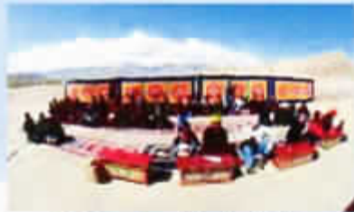
Cérémonie d'implantation de l'Institut

Ladak : La construction de la première aile de l'Institut Bouddhiste Ngari, à Saboo Skidchen, comprenant l'école, le réfectoire et l'internat, est déjà avancée. Celle du dispensaire financé par Solidarité Homéopathie, est en cours. Il pourra bientôt nous accueillir.