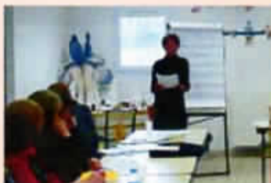
Atelier d'anthroposophie au centre Socio-Culturel de Garons