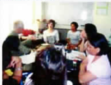
Enseignement des Thérapeutes de V.P.H.C.S.

Une deuxième mission de 4 mois a commencé le 17 décembre 2011, toujours en collaboration avec l'association caritative locale (V.P.H.C.S) qui œuvre dans les bidonvilles de Cebu.