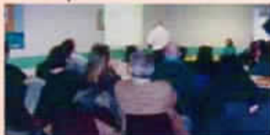
Conférence dans une salle de la Mairie de Tassin La Demi-Lune