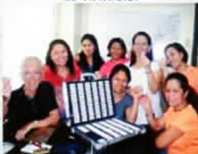
Fabrication de remèdes