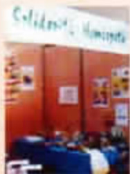
Participation au Forum des Associations de Cannes