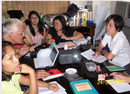
Enseignement au centre de VPHCS