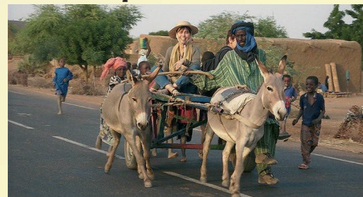
Déplacement dans les villages