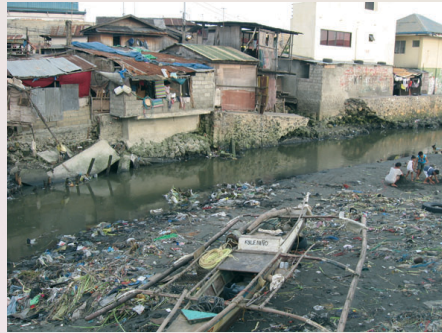
Le bidonville de Cebu