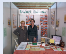
Stand au Salon Sésame