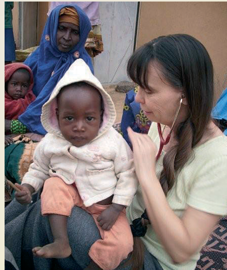
Auscultation d'un bébé