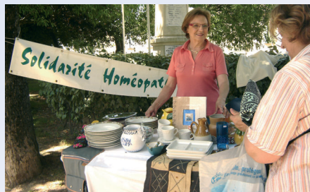
Vide-Greniers à Bouillargues