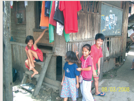
Enfants dans le bidonville

Les membres de l'équipe VPHCS apprennent vite et bien et sont déjà prêts à enseigner l'homéopathie aux « Aide-Soignants » qui exercent dans les campagnes !