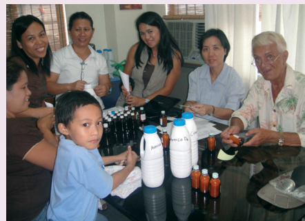
Préparation de médicaments homéopathiques

Au Centre de VPHCS, toute une pharmacopée homéopathique est créée à partir des TM et des granules vierges amenés de France. Cette pharmacopée va leur permettre de soigner en attendant notre retour !