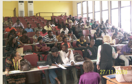
Enseignement de l'Homéopathie à la Faculté de Médecine de Brazzaville