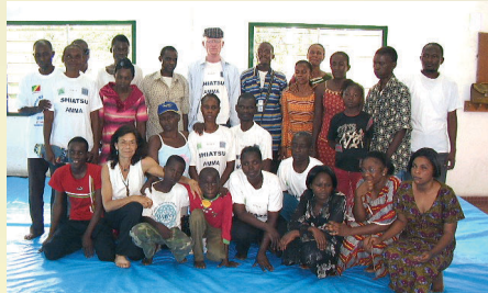
Le groupe d'étudiants non-voyants avec leur enseignante en Shiatsu