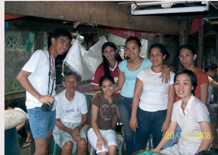
L'équipe des bénévoles

Au Centre de VPHCS, toute une pharmacopée homéopathique est créée à partir des TM et des granules vierges amenés de France. Cette pharmacopée va leur permettre de soigner en attendant notre retour !