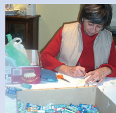
Tri de médicaments homéopathiques