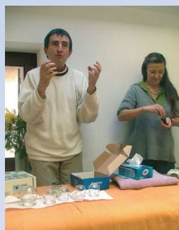
Initiation à la pose de ventouses au dispensaire du Val de Drôme