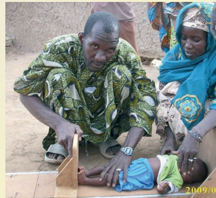
Check en consultation de pédiatrie